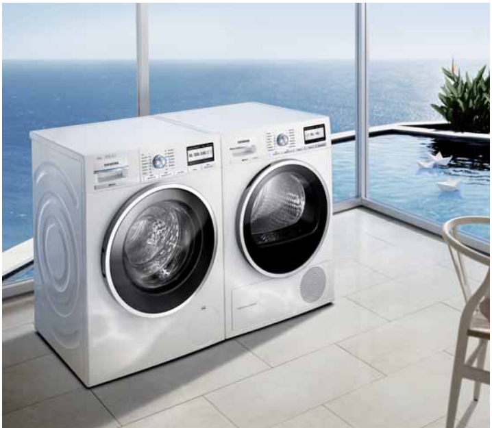
„Traumpaar“: Waschmaschine und Trockner aus der Serie „iQ 800“ passen optisch und technisch bestens zusammen