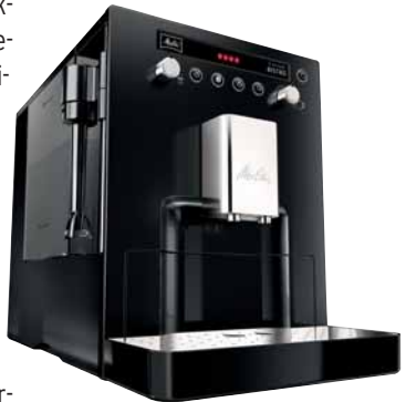
Der Kaffee-Vollautomat „CAFFEO Bistro“ verbraucht weniger Energie

verschiedenen Kaffeestärken ausgewählt werden – von extra mild bis extra stark. Als einziges Gerät seiner Klasse hat die „Gourmet“ einen Zwei-Kammer-Bohnenbehälter. So können Kaffee-Genießer zwischen zwei verschiedenen Bohnen wählen. Der Drehschalter „Rotary Switch“ und ein übersichtliches Text-Display erleichtern die Bedienung und Programmierung bei der Kaffeezubereitung. Die „CAFFEO Gourmet“ ist ab November 2011 im Fachhandel erhältlich.