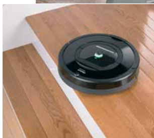
Feiern auf der IFA ihre Europapremiere: Die intelligenten Saugroboter „Roomba 770“ (links) und „Roomba 780“ (oben)